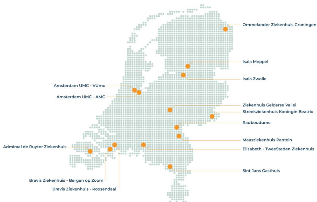
Figuur 2.1: Locaties van LIS-ziekenhuizen 2023

LIS vormt hét systeem in Nederland dat inzicht biedt in het aantal, de aard en de oorzaken van letsels waarmee mensen op de SEH belanden. Op dit moment doen 12 Nederlandse academische en algemene ziekenhuizen mee. Daar wordt op 14 SEH-locaties informatie verzameld over ongevallen en letsels (zie figuur 2.1). Deze SEH's vormen een representatieve steekproef. De gegevens van de 14 SEH's worden gewogen om uitspraken te doen over heel Nederland.